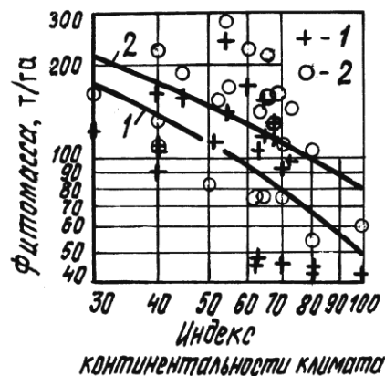
Рис. 3. Связь расчетных по уравнениям (1)–(3) показателей надземной (1) и общей (2) фитомассы 55-летних березняков с индексом континентальности климата (по С.П. Хромову [11])