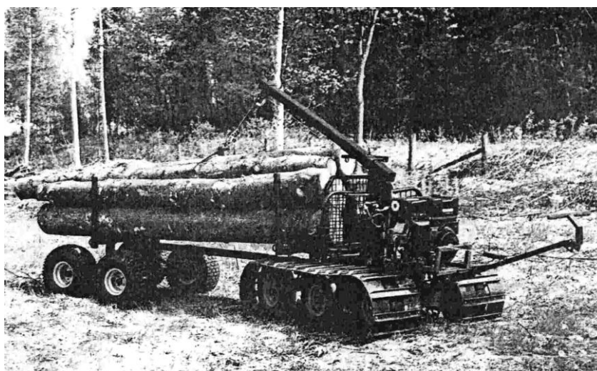
Рис. 2. Малая универсальная машина мини-трактор ОХЕН

При проведении первых приемов рубок ухода, удалении семенников в лесах естественного возобновления, санитарных рубках и разработке буреломов наряду с традиционным средством трелевки применяют малые универсальные трактора (рис. 2). Характеристиками таких агрегатов являются: эксплуатационная масса 300 ... 500 кг (без прицепа), рейсовая нагрузка 1,0 ... 1,5 м 3 , мощность одно- или двухцилиндровых бензиновых четырехтактных двигателей 3,7...12,0 кВт. Ее движением управляет идущий впереди рабочий. Среднегодовая продолжительность использования гусеничной мини-машины составляет 150 дн.