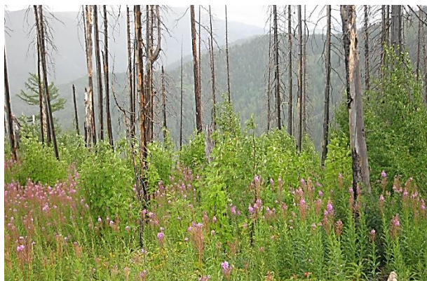
Рис. 2. Вторая восстановительно-возрастная стадия послепожарного формирования растительности (11-летняя пихтовая гарь на западном склоне)

Смыкание лиственного полога происходит к 10...11 годам после пожара, причем лиственные молодняки размещены на гарях неравномерно: березовые – в виде полос шириной до нескольких десятков метров в небольших понижениях или на ровных участках, а также единичными особями равномерно по площади; осиновые – куртинами (очагами) диаметром до 15 м вокруг погибших материнских деревьев.