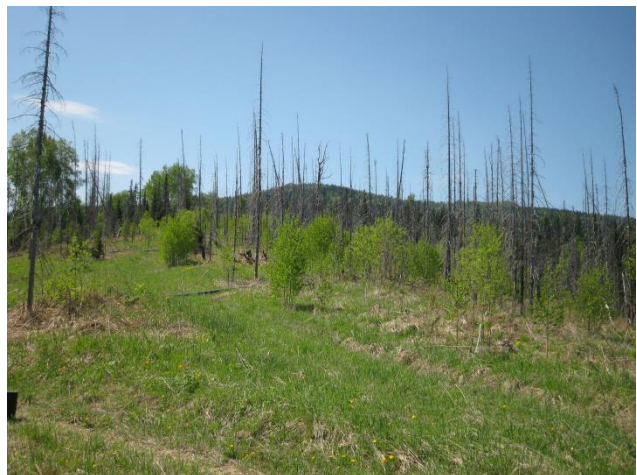
Рис. 4. Вторая восстановительно-возрастная стадия послепожарного формирования растительности (11-летняя пихтовая гарь)

На вершинах склона, где проходит граница гари, наблюдаются сухостойные пихты, постепенно отмершие после пожара, но находящиеся в вертикальном положении. Гарь не разработана. Практически весь склон СВ экспозиции (передний план, рис. 5) возобновился березой семенного происхождения в количестве 4311 шт./га. Возраст подроста и молодняка березы колеблется от 5 до 30 лет, расположение – небольшими колками.