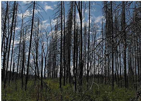
Рис. 1. Первая восстановительно-возрастная стадия послепожарного формирования растительности (свежая 2-летняя пихтовая гарь)

Вторая стадия (рис. 2): травяно-кустарниковые ассоциации и формирование лиственных молодняков (от 3 до 10...15 лет). На первоначальном этапе она представлена сочетанием на гарях нескольких основных видов трав и кустарников. Начинают появляться спирея и малина. При наличии источников семян накапливается самосев березы, рябины, ивы, которые, наряду с корнеотпрысковыми экземплярами осины, совместно начинают заселять пространство гари, образуя куртины. Продолжительность и характер этой стадии определяется в большинстве случаев наличием семян березы и характером их распространения, а также возможностью появления осины вегетативного происхождения.