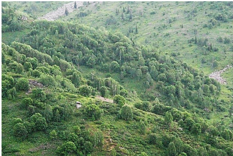
Рис. 5. Третья стадия (панорамный вид 34-летней гари)

Количество подроста пихты достигает 3724 шт./га, который произрастает под пологом производных березовых насаждений и имеет куртинное размещение. На таких склонах в будущем сформируется низкополнотное насаждение пихты. На склоне С экспозиции (дальний план, рис. 5) подрост предварительной и последующей генераций высотой более 1,0 м расположен равномерно по склону и формирует редины. Период восстановления коренных хвойных насаждений в таких условиях составит не менее 150...200 лет.