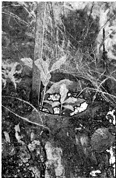
Рис. 1. Культуры дуба, созданные посевом в пень

Содержание воды в почве определяли весовым методом: бюксы с грунтом высушивали в сушильном шкафу при температуре 100...105 °С и по потере в массе рассчитывали влажность грунта.