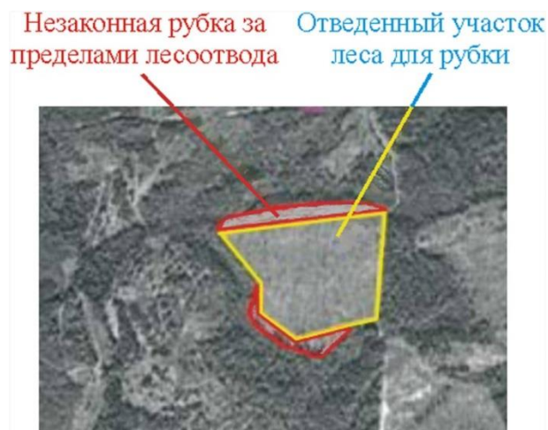
Рис. 1. Фрагмент аэрокосмической съемки лесного фонда

Анализ существующих современных способов и методов мониторинга лесов (таких как аэрокосмический контроль, видеонаблюдение и патрулирование лесов) показал их недостаточность для предотвращения незаконных рубок. В большинстве случаев факты незаконной рубки устанавливаются по истечении времени, причем даже в случаях переруба, как это показано на рис. 1. Процедура установления исполнителя и времени незаконной рубки достаточно сложна. Фиксация переруба лесосеки с использованием аэрокосмических снимков вызывает затруднения. Причина в том, что большинство из них имеют разрешение 5,0...10,0 м и служат в качестве индикатора состояния участка (есть изменения или нет), другая часть снимков имеет чуть большее разрешение – 2,0...5,0 м, снимков с необходимым разрешением 0,5...1,0 м мало из-за их высокой стоимости.